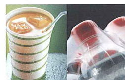
„Grüner“ Kunststoff Seite 16