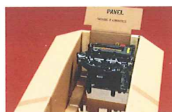
Innovative Verpackung für Motoren Seite 8