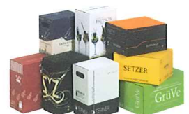
Wellpappe zieht Bilanz Seite 20