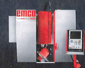
MAXXMILL 500 Vertikales Fräszentrum für die 5-Seitenbearbeitung