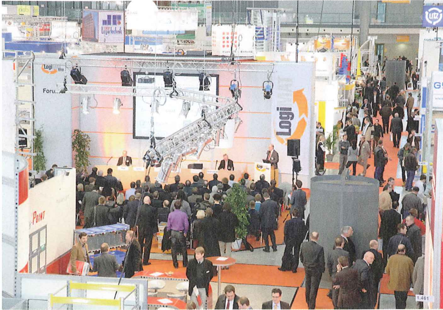
Die verschiedenen in die Ausstellung integrierten Forenflächen waren mehrheitlich gut frequentiert.