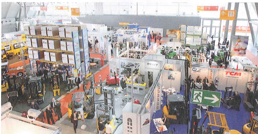
Die Logimat bietet einen nahezu vollständigen Marktüberblick über die gesamte Intralogistik-Branche.

Um den roten Zahlen zu trotzen, setzen die Unternehmen auf Massnahmen wie Umstrukturierung, Prozessoptimierung sowie verbesserte Kosten- und Energie-Effizienz durch intelligente Steuerungssysteme.