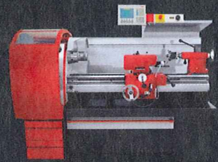
EMCOMAT 20 D Universal Drehmaschine für industrielle Anwendungen