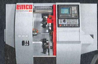
HYPERTURN 45 Hochleistungs-Drehzentrum für die Komplettbearbeitung