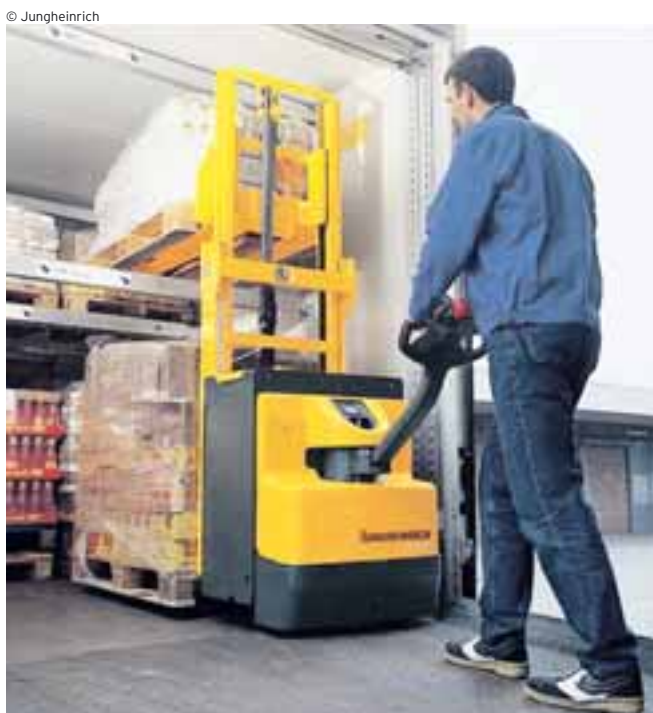
Einfache und effiziente Handhabung verspricht das neue Doppelstockgerät von Jungheinrich

INNOVATION. Das Multitalent von Jungheinrich (Typ EJD 220) ist in der Lage, Arbeiten sowohl von Niederhub- als auch von Hochhubwagen auszuführen.