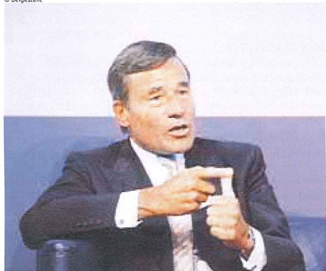
Wolfgang Grupp ist als Diskutant voll in seinem Element