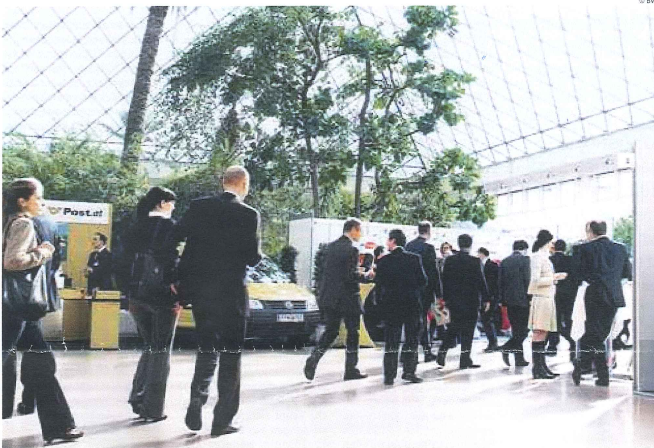
Rund 500 Logistik-Experten treffen sich alljährlich beim BVL-Logistik-Dialog zum aktuellen Gedankenaustausch

Wie erwähnt steht jeder Logistik-Dialog unter einem bestimmten Generalthema. Skaret dazu: „Nachdem wir uns im vergangenen Jahr dem Thema Green Transport gewidmet haben, greifen wir heuer die Volatilität der Wirtschaft auf und versuchen abzuklären, wie die Logistik als Werkzeug auf diese unterschiedlichen Herausforde-