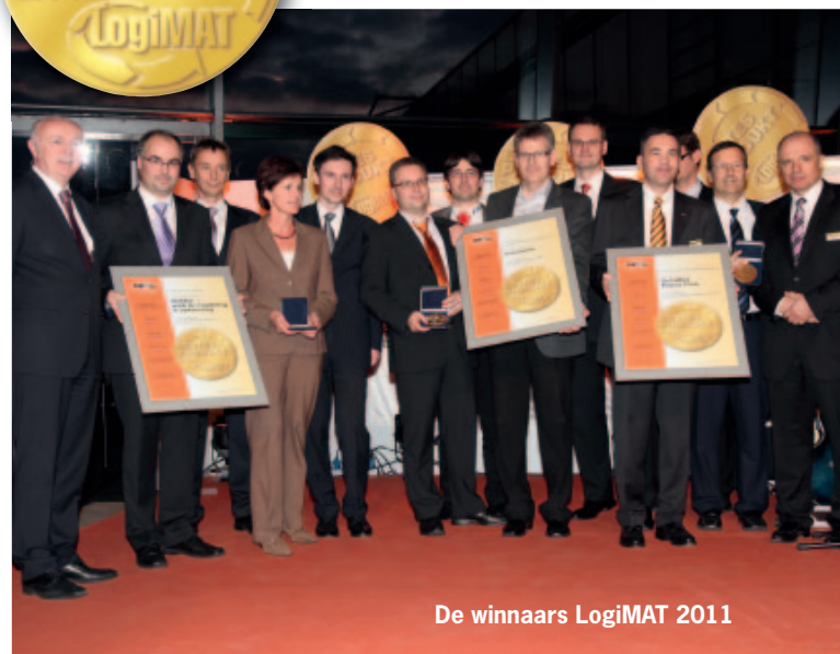
De winnaars LogiMAT 2011